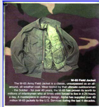
M-65 Field Jacket Vintage Made in USA